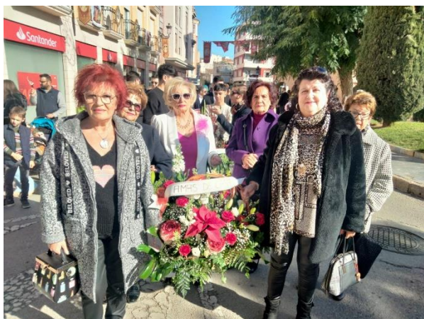
Ofrenda Floral a Santa Eulalia de la Asociación de Amas de casa, Consumidores y Usuarios de Totana