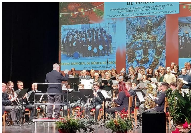
Concierto de Navidad en Teatro Guerra de la coral de la Asociación de Amas de casa, Consumidores y Usuarios de Lorca y la Banda Municipal