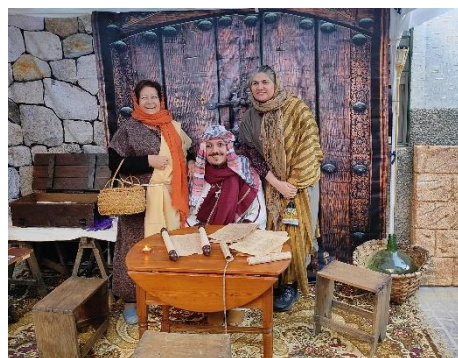
Belén Viviente de la Solana: Asociación de Amas de casa, Consumidores y Usuarios de Abarán