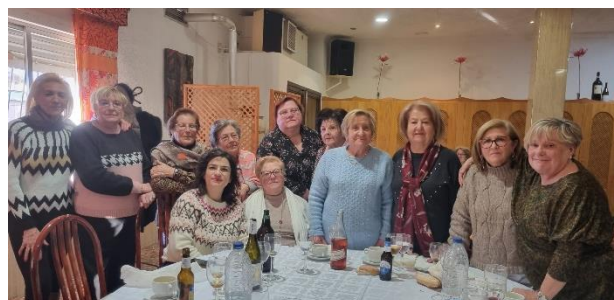
Ofrenda Floral a Santa Eulalia de la Asociación de Amas de casa, Consumidores y Usuarios de Totana