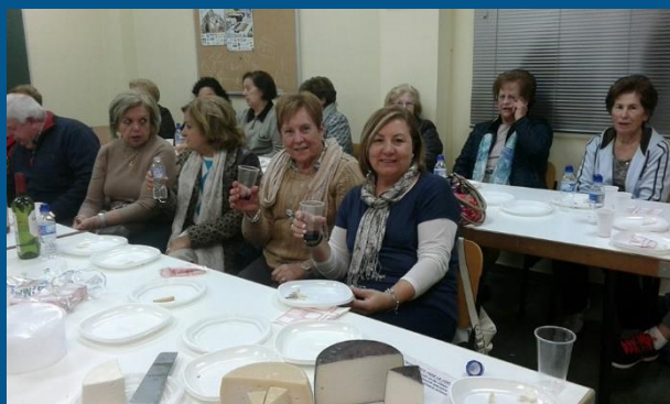
Cata de quesos murcianos organizada por THADERCONSUMO en la pedanía de Monteagudo