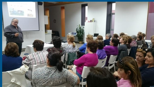
Taller informativo en El Algar para explicar los diferentes quesos de nuestra tierra