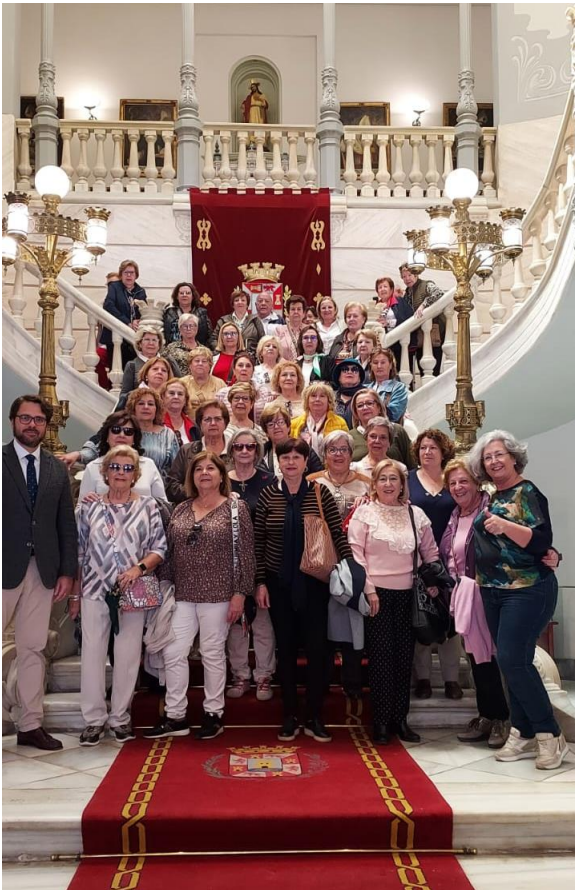
La Asociación de Amas de Casa, Consumidores y Usuarios de Cieza visitan la Refinería de Repsol y el Palacio Consistorial de Cartagena