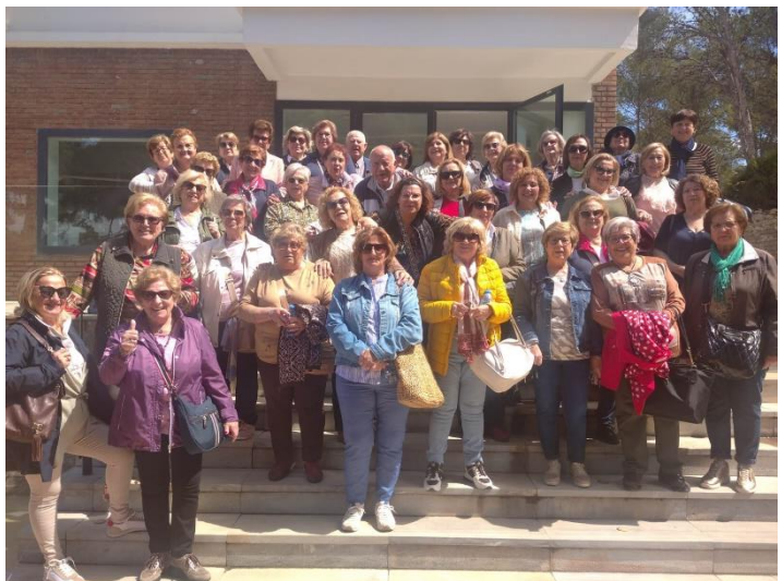
La Asociación de Amas de Casa, Consumidores y Usuarios de Roldán visitan Letur